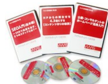
▲活用実習ノウハウDVD